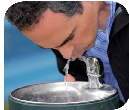
Reiner Genuss – dank einer hochwertigen Trinkwasserinstallation.